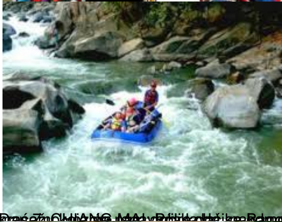
Práček v Gula Nig, AdAv, Přítko, Ház, B, Dm, křídlo, jid, o, g, p, a, t, o, r, a, n, j, a, p, a, v, e, t, e, r, e, o, p, t, i, j, a, n, d, s, e, U, z, e, Č, a, i