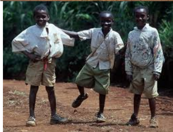
Kilimanžaro, Serengeti, žirafa, Maasai, savana, delfin