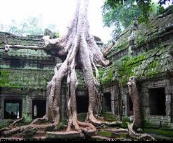
Obilježje Kambodže - Angkor Vat, najveći kompleks kraljevskih palača i hramova u svijetu