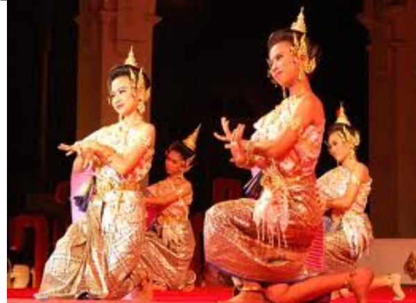
Obilježje Tajlanda - tradicionalni balet, najpoznatiji je balet (jantong), koji se izvodi u hramovima